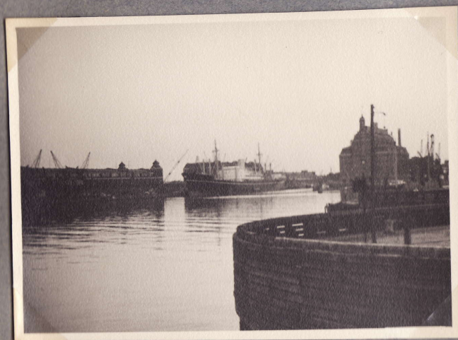
Satamanäkymä "Kambodia" kustalla. Köpenhamina 30.7.48