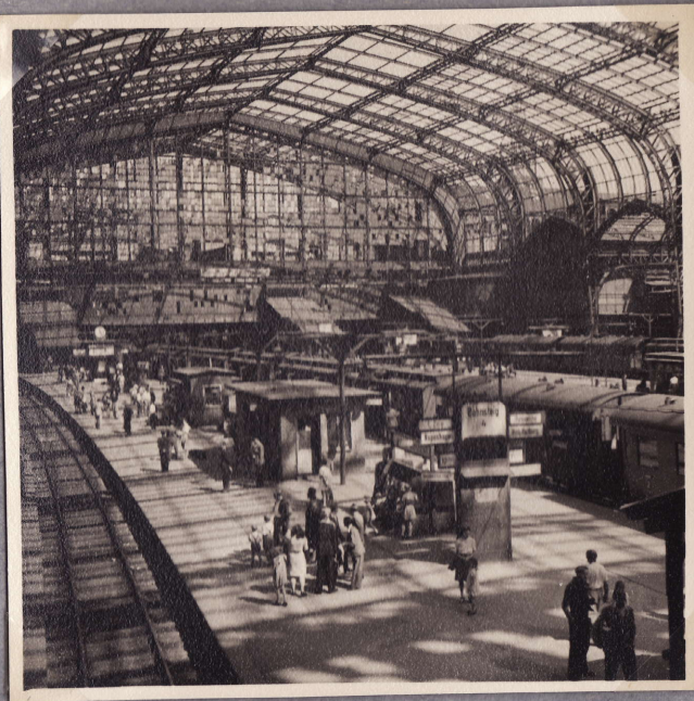
Kuvia Hampurin pääasemalta.