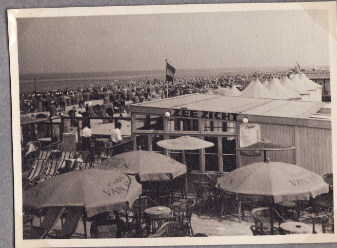
Kuvia Scheveningen laajalta hiekkarannikolta 1.8.48