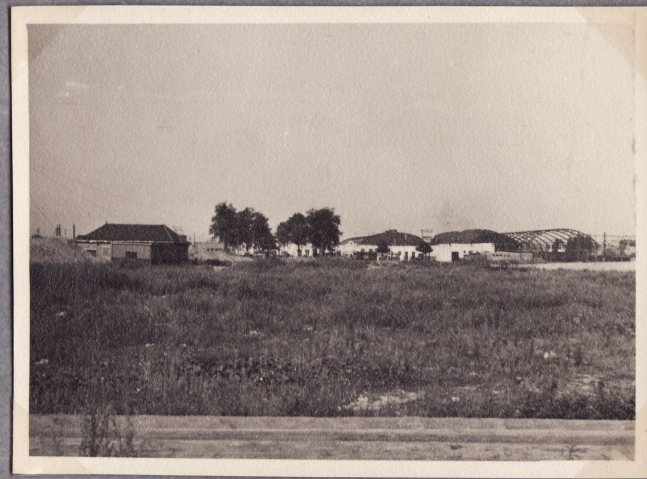
Kaupungin keskustaa. Taustalla pääasema. 5.8.48