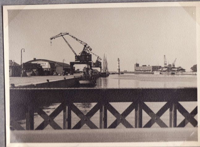
Malmöön kanava. 30.7.48