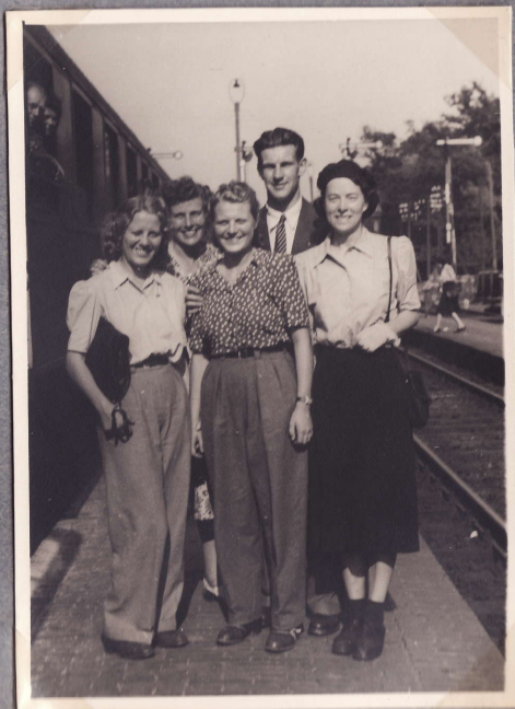
Norjalaista matkaseuraa. Bentheim