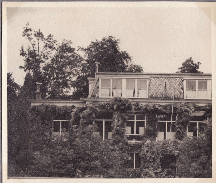
Talo Iaitakaupungilla Rotterdam 3.8.48