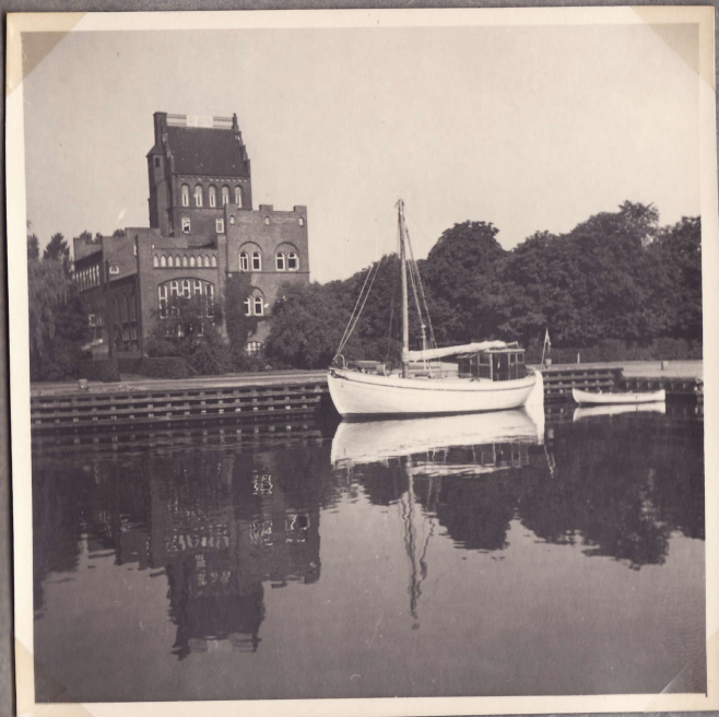
Landskronan kanava. 29.7.48