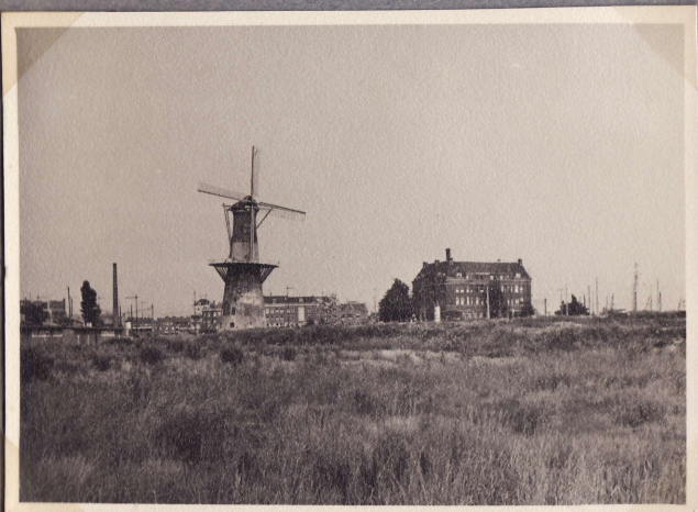
Molen aan Oosplein Rotterdam 1.8.48