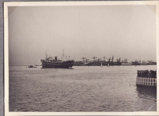
"Talbot" Burmeister & Wain'in edustalla 30.7.48