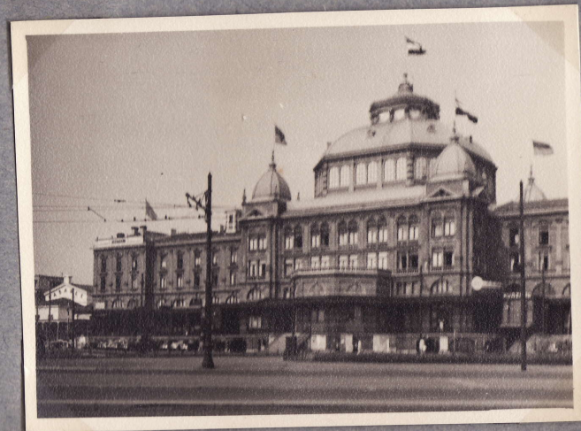
Hotel Kurhaus Scheveningen 1.8.48