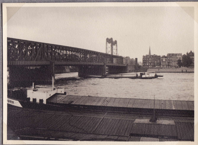
Rautatie-silta yli Maas-joen 3.8.48