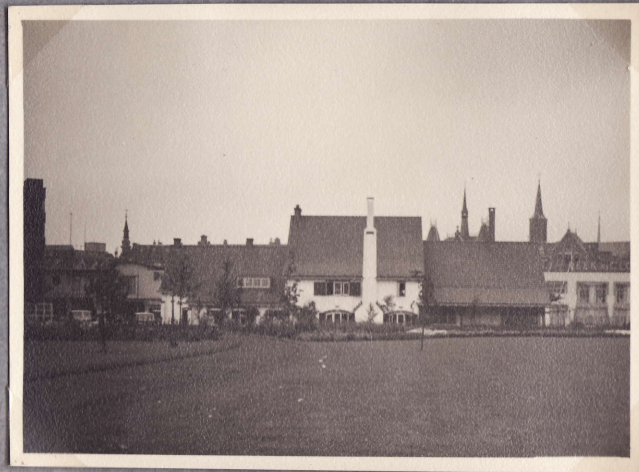
Ravintola "Old Dutch" Rotterdam 3.8.48