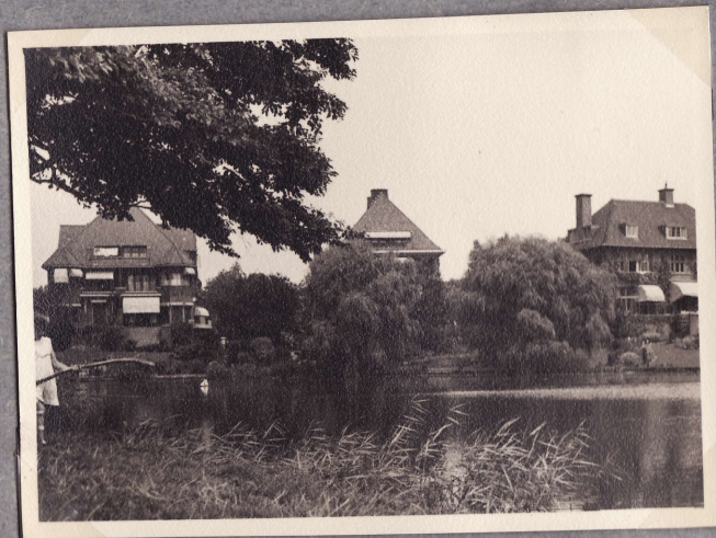
Bloemen Tentoonstelling'n puutarha-alueella Scheveningen 1.8.48