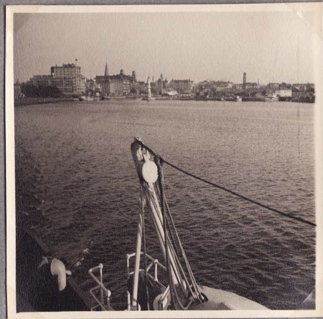
Malmö jää taakse 30.7.48