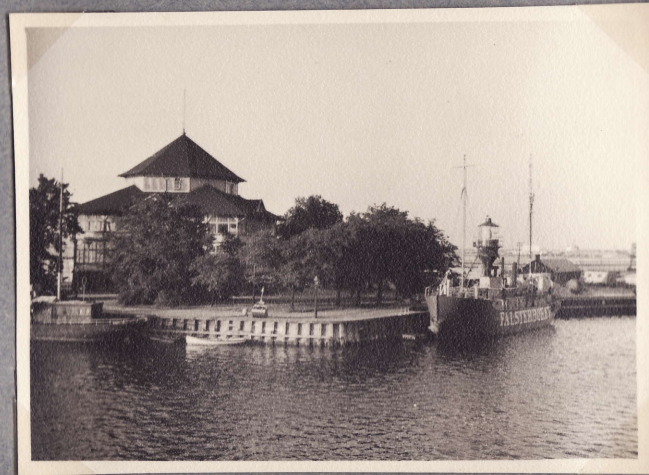
Malmöön satamaa. 30.7.48